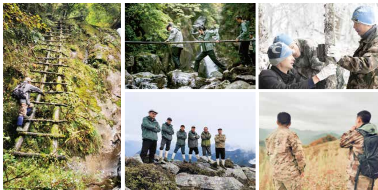
2023年，桃花源生态保护基金会的工作人员在五个保护地共完成了27873公里的巡护任务

通过十余年的悉心保护，羚牛、川金丝猴等国家一级保护动物重返公益保护地。2023年，巡护员在四川老河沟保护地多次观察到野生大熊猫，这意味着自然保护地正在恢复它原有的生命力。