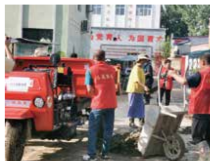
开展以工代赈项目

2023年7月底，京津冀地区受台风“杜苏芮”影响，银泰集团捐赠100万元人民币，采购赈济家庭箱，保障了受灾群众的基本生活需求。同时，银泰公益基金会携手中国红十字基金会开展“以工代赈”试点项目，鼓励和支持村民参与本村清理、重建和生产恢复；通过支持乡村配置设备设施，助力恢复重建与开展生产；此外，银泰公益基金会还捐赠了9艘搜救艇，帮助河北、天津等地的救援队提升救援能力，为今后水上救援行动提供有力保障，提升乡村的自救能力。