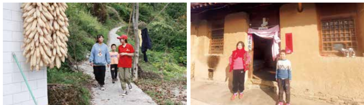
随着入户走访的深入，工作人员已经能明显感受到孩子甚至整个家庭的变化

2023年底，银泰公益基金会发起“暖冬行动·感恩有你”活动。此次活动收集到的衣物、玩具等物资，全部通过银泰公益基金会捐赠给乐予基金会“西部温暖计划”，让西部地区的孩子们在严寒冬日感受到一份暖意。银泰基业集团在北京、杭州、成都三地写字楼同步设置衣物回收点，方便写字楼客户参与活动，让爱的力量汇聚传递。