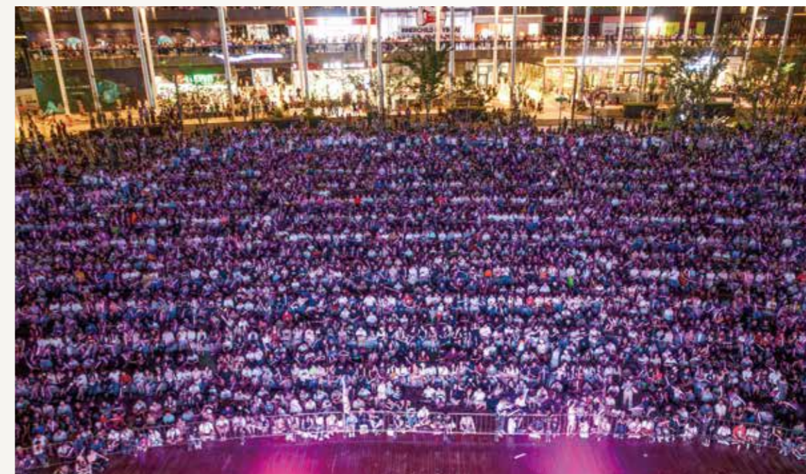
郑州银泰inPARK创新营销催化人气聚集

郑州银泰inPARK的开业，标志着“街区 + shopping mall + 微景观”的商业新形态在中原地区的成功落地。郑州银泰inPARK将继续致力于拓展潮流、多元、活力的商业消费新生态，通过聚集效应促进郑东新区商圈提质升级，为打造河南乃至中原经济区的“金名片”贡献力量。