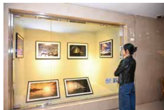
西藏阿里风光公益摄影展

在北京银泰中心15周年之际，银泰公益基金会携手银泰基业集团、北京苹果慈善基金会举办公益摄影展、公益花车义卖等多种活动，促进西藏阿里地区旅游产业的发展，为乡村振兴注入了新的活力。