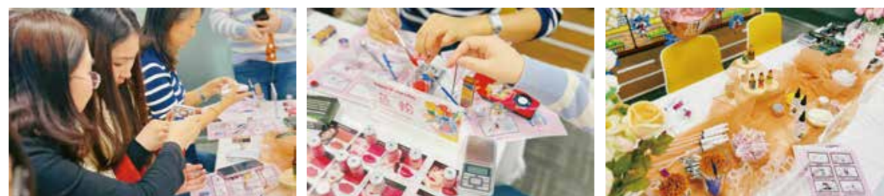
公司组织3·8妇女节手工活动

公司高度关注女性员工福利保障，积极解决女职工普遍关心的平等就业、薪酬福利、休息休假、教育培训、生育保险等问题，保障女职工的合法权益。此外，公司在全集团范围发起“爱在一起·温暖同行”专项爱心倡议，帮扶困难员工，彰显银泰人的大爱与担当。