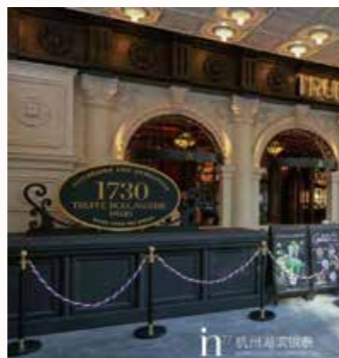
in77杭州首店 1730 · TRUFFE BOULANGERIE

在存量时代下，首店经济越来越成为商业项目打造自身差异化的重要手段，也是各地提升城市商业魅力的重要举措。未来，银泰商业管理集团将以更加开放的姿态，创新的精神，以及品质化和精细化的运营，进一步加强首店品牌的引进、培育和孵化，为城市的繁荣和居民的生活品质提供强大助力，打造品质消费新动能，促进城市商业高质量、可持续发展。