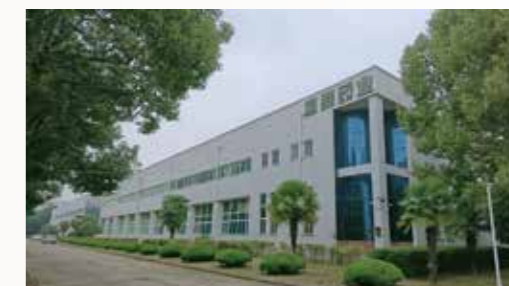
国森药业厂区内部情况

国森药业破产重整项目的圆满落地，展示了瑞京资产在面对复杂多变的市场环境中的专业性和高效性，通过强大的资源整合能力和生态圈资源，为化解区域金融风险 and 助力产业发展提供了创新的思路和解决方案。