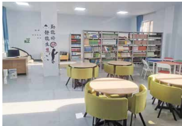
支持内蒙古乌兰察布市卓资县北京朝阳学校建立阅览室

银泰集团积极贯彻党中央关于乡村振兴战略部署，深入偏远地区，实施精准帮扶，推动当地教育和文化产业的发展。银泰基业集团捐赠支持内蒙古乌兰察布市卓资县北京朝阳学校（初中部）建立阅览室，支持化德县第一中学购置电脑、打印机等办公设备。这些举措都显著提升了学校的教学环境，为学生们的后续学习创造了更为有利的条件。