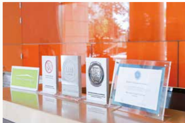
北京银泰中心获得一系列绿色节能成就

绿色、低碳、健康是北京银泰中心一直以来不懈追求的发展目标。在新冠肺炎疫情期间，北京银泰中心持续关注楼宇使用者的健康，在清洁卫生、应急准备、健康服务资源、空气和水质量管理等方面实施了一系列保障措施，如配置AED急救设施、对管理团队进行急救培训、定期检查空气和水质等。