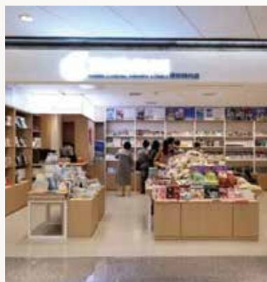
in77浙江首店 天闻角川