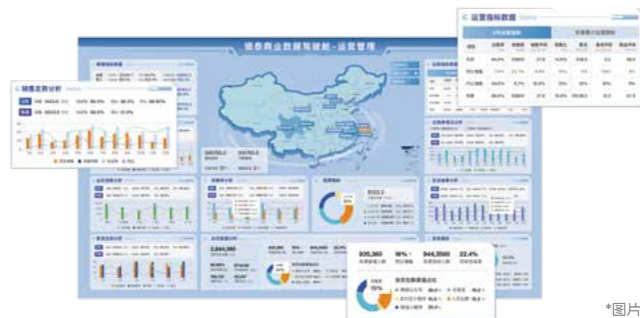
*图片数据非实际数据

通过业务平台，银泰商业管理集团实现铺位、合同、运营和财务预算全流程化、规范化管理，统一管理标准。会员平台实现多渠道运营，打造私域流量线上服务空间。商户运营服务平台为2502个商户赋能，提升商户运营管理能力 and 新零售全渠道销售能力，依托银泰商业大生态体系，提供会员导流、异业合作和金融服务。