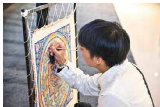
画师现场绘制唐卡作品

2023年7月，银泰基业集团旗下杭州银泰购物中心有限公司与四川省甘孜州泸定县得妥镇椒子坪村签订《2023年企村结对帮扶框架》，通过资源整合，改善当地居民基本生产生活条件，提高公共服务水平，巩固拓展脱贫攻坚成果，助力推进乡村振兴。